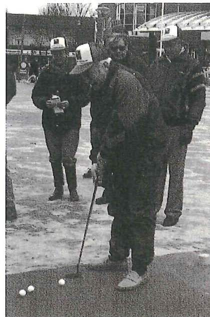
Arrangementet på Bymidten i november blev et tilløbsstykke.